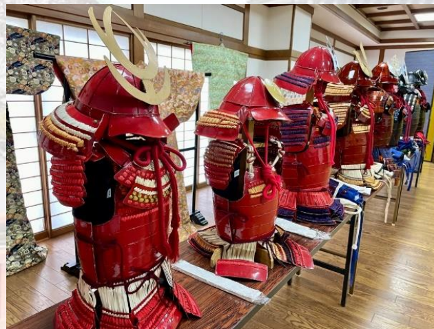
甲冑試着体験の実施

また、11月～12月にかけて、清洲城周辺でイルミネーションイベント「きよすイルミ」を開催し、清洲城・清洲ふるさとのやかたの夜間営業を行うなど、清洲城のPR・観光誘客促進を行っています。