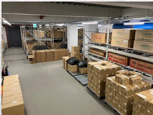
五条川防災センター