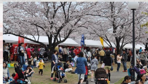
■ 春日五条川さくらまつり (3月下旬頃)

コロナ禍でしばらく中止していた花火の打ち上げも、2025(令和7)年から再開しました。