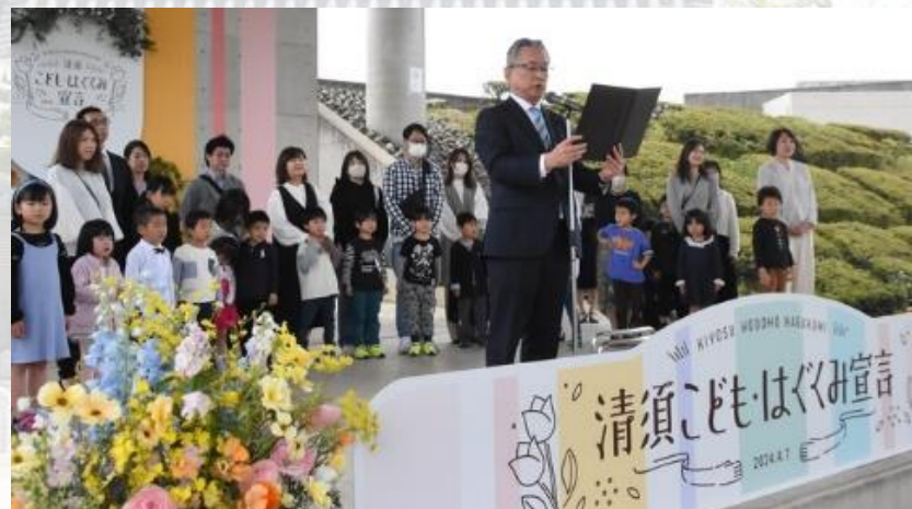
清須こども・はぐくみ宣言式（2024(令和6)年4月7日）

そのうえで、妊娠・出産・子育ての希望をかなえるための伴走型支援の充実に力を入れており、2024(令和6)年度からは母子保健推進委員による乳児家庭訪問の回数を増やすとともに、訪問時のおむつ券の配布を行うなど、子育てのしやすい環境づくりに取り組んでいます。