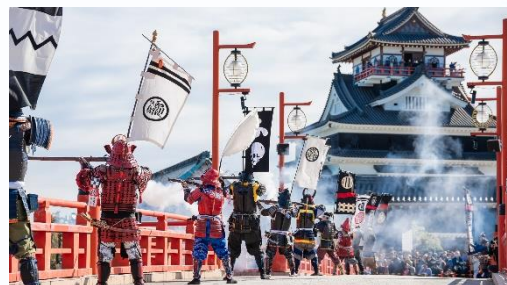
■ 清洲城信長まつり (10月)

毎年秋に清洲城一帯で開催され、時代行列や火縄銃演武、ステージイベントなどが行われます。