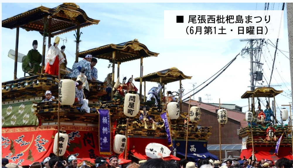
■ 尾張西枇杷島まつり (6月第1土・日曜日)

年間を通じて、地域の伝統や特色を生かした祭り等のイベントを開催しています。市内外から多くの来場者が訪れ、地域に活気や賑わいを創出するとともに、祭りへの参加を通じて地域の方たちの「まちへの誇りや愛着」へとつながっています。