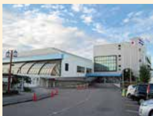
清洲勤労福祉会館

問 工事内容の内訳は。 答 設備工事としては、EHP室外機・室内機新設に1億8千万円、受変電設備及び非常用発電機更新に1億2千400万円、建築工事としては、外部屋根屋上防水工事に8千200万円などとなります。