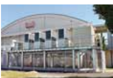
西枇杷島中学校 体育館

③防災備蓄倉庫の老朽化が進み、倉庫内に雨漏りが生じている所もあるため、防災資機材等の再整備、また倉庫本体の再整備を行うための準備を進めているところ