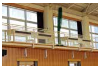
体育館の空調設備