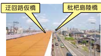
伏見町線 名古屋市方面から清須市方面を望む

ら概略設計を実施して おり、拡幅や整備によ る周囲への影響や課題 などについては、ワー クシヨップなどで地元 の意見も伺いながら進 めると聞いています。 ④県からの回答では、春 日橋交差点は鋭角の上、 一部区間では歩道も狭 いため、事業化に向け 今年度から関係機関と の調整に入ると聞いて います。