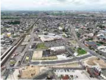
名鉄新清洲駅上空から