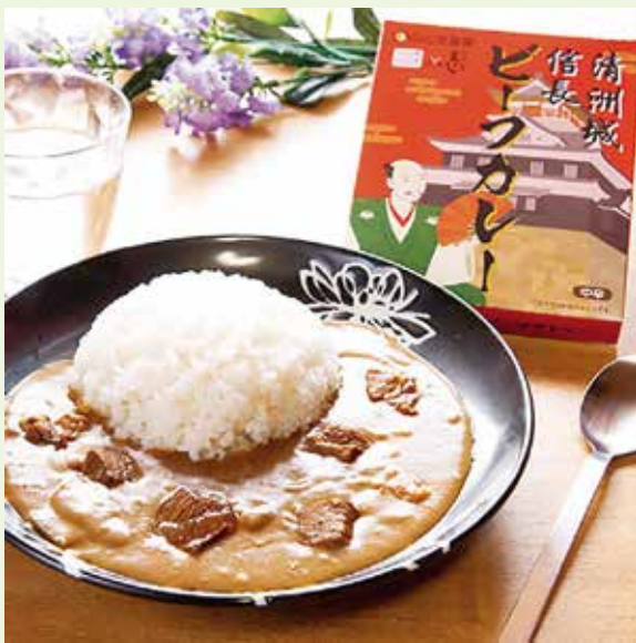
ふるさと納税寄付 返礼品の一例