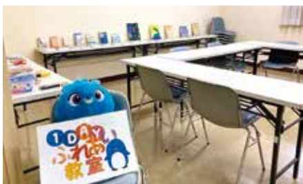
1day a week教育支援(ふれあい)教室

答 一人ひとり事情の 違う中で、個別に最適な 方法を探る必要がある と考えています。学びが 継続できる場所、児童生 徒に応じた学びへのア クセス、また環境をしつ かりと整え、各機関との 連携強化を踏まえて迅 速に対応していきたい と考えています。議員ご