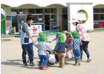
保育園で遊ぶ子どもたち