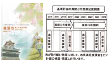
清須市 第2次総合計画 後期基本計画(2020~2024)

③ 令和2年9月議会での「業務委託の評価・検証について」、業務を委託する場合、コスト比較、費用対効果、効率性等の評価・検証を行っています。業務委託基準となるガイドラインの策定については、引き続き調査・研究をしていきます。