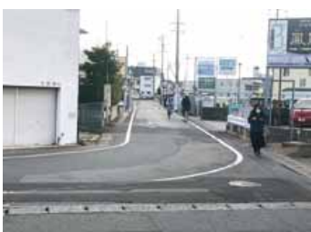
清洲駅前線の現状

整い次第、令和6年度末の事業完了を目指し、速やかに施工していく予定です。 ②清洲駅前線は、清洲駅と県道名古屋一宮線を結ぶ非常に重要な道路と認識しています。区画整理区域外の駅前線に