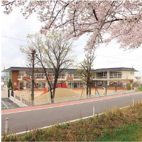
ゆめのもりこどもえん