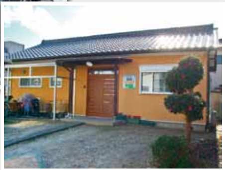
小規模保育事業施設の フィリオ清須となのはな保育園