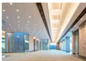
完成した五条川斎苑