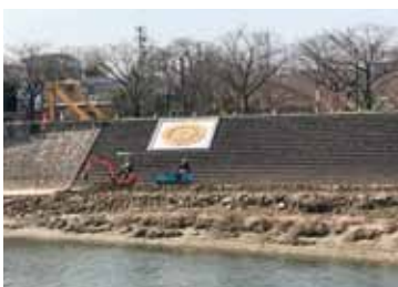
散策路の堆積土砂撤去の様子