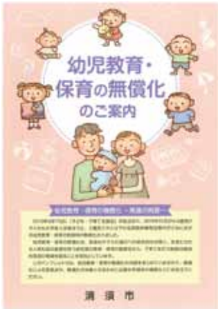
令和元年10月より 幼児教育無償化スタート