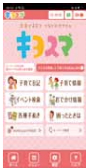
子育てアプリ キヨスマ