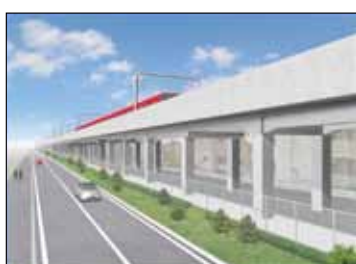
名鉄高架イメージ図

③仮橋の設置時期は、検討中と聞いています。また、狭小部の解消は、下流の河床の掘り下げを先行して実施していく