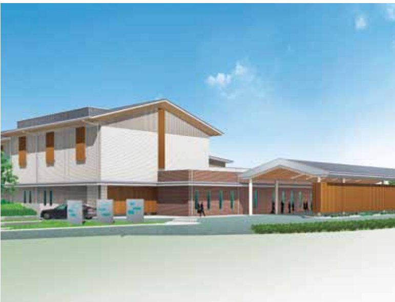
斎苑施設完成予想図

答 保育所入所選考にあたり、令和2年度の受付内容と、新たな保育所入所A1選考システムとの整合性を確認しながら、導入を進めていきます。