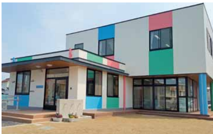
4月に開園した西枇杷島児童センター