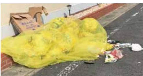
カラス被害に遭ったごみ集積場