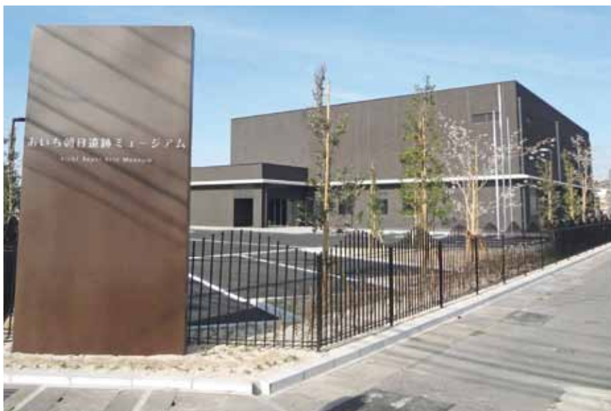
秋にオープン予定のあいち朝日遺跡ミュージアム

答 あいち朝日遺跡ミュージアムの開館に併せて清洲城との間を楽しみながら、わかりやすく歩くことができるよう遊歩道を整備し、城と朝日遺跡を連想させるようなペイントを等間隔に描き、解説板を20か所程度設置します。また、市内小学6年生から遊歩道の名称を募集します。