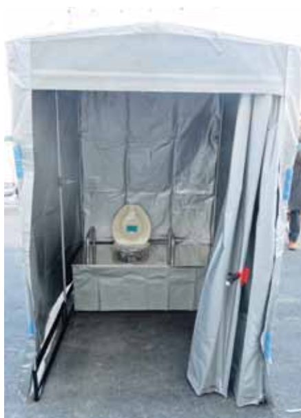
マンホールトイレ

答 県と市が協調して補助するもので、障害物検知機能付きは、基準額が8万円、それに対して、国からの補助が4万円、残りの4万円に対して、県と市が限度額3万2千円を補助するものです。障害物検知機能無しは、基準額が4万円、それに対して、国からの補助が2万円、残りの2万円に対して、県と市が限度額1万6千円を補助するものです。補助予定台数は130台を見込んでいます。