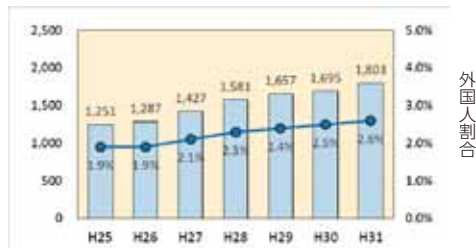
図：清須市の外国人人口及び割合の推移 (各年4月1日 住民基本台帳より)

外国人との共生に向けた環境づくりへの課題は、日本社会の中で自立して生活していくための支援、日本語や日本の