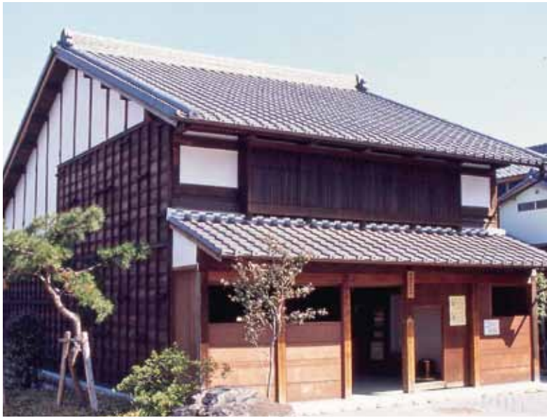
西枇杷島問屋記念館

問 西枇杷島問屋記念館の管理運営規則に問屋記念館の目的に沿った行事に関するところがあるがその内容は。 答 資料の保存、公開等を実施していますが、今後行事等についても検討していきたいと思えます。