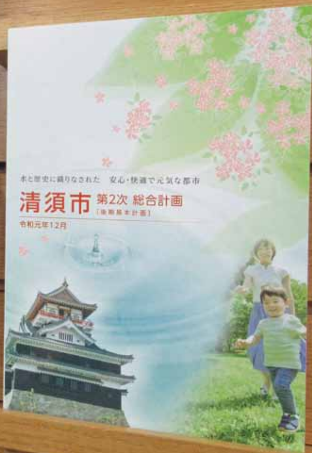
右：清須市第2次総合計画 後期基本計画 左上：清須市地域公共交通計画 左下：清須市公共施設個別施設計画