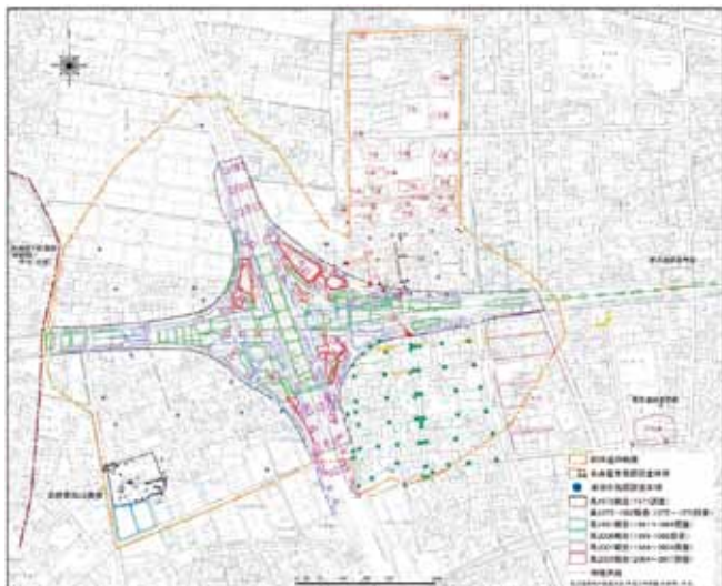
貝殻山貝塚、朝日遺跡発掘調査位置図(愛知県HPより) 朝日遺跡の面積は貝殻山貝塚資料館の敷地面積のおよそ100倍あります。

答 県においては、平成27年度に史跡貝殻山貝塚の整備及び新資料館の建設に伴い「史跡貝殻山貝塚保存管理計画」及び「愛知県清洲貝殻山貝塚資料館拡充基本構想」を策定し、委員には地元自治体代表者として教育長が参画しています。現在は「にぎわい創出」推進会議において、新資料館の拡