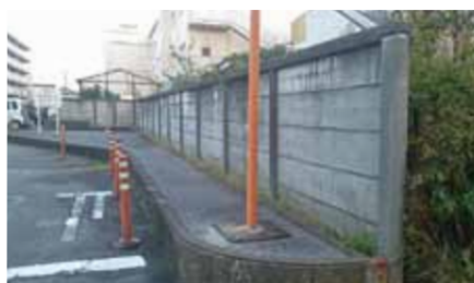
新川中学校の万代塀