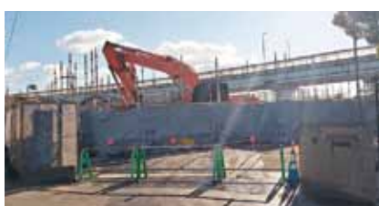
建設中の幼保連携型 認定こども園(一場)

第一期計画(平成27 (平成31年)に対する 現況の幼稚園保育園の 入園状況の「かい離」 についての報告と評 価、それを踏まえた新 計画の策定手法、そし て幼児教育無償化、乳 幼児保育ニーズの増 大、地元園に希望通り 入れない状況を踏まえ た今後の本市の施設整 備計画についての考え を伺います。