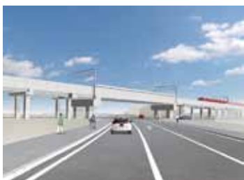
鉄道高架事業完成予想図