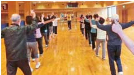
きよすスポーツクラブ(シニア健康体操)