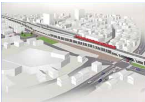
新清洲駅と県道給父清須線イメージ