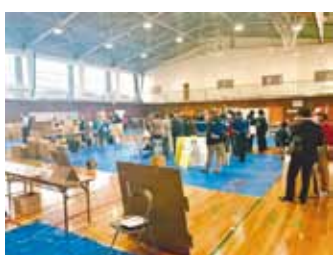
ボランティア団体による避難所運営訓練

④ 先進地事例や、災害時のペットにまつわる課題、県の同行避難対策の動向などを含めて検討していきます。