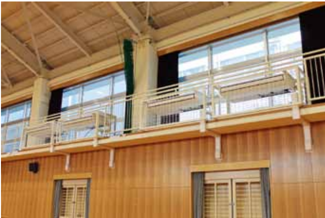
体育館の冷暖房設備

問 冷暖房設備の維持管理はどのように行っていくのか。 答 普通教室のエアコンと同様に、長期継続契約でメンテナンスを実施していきたいと考えています。