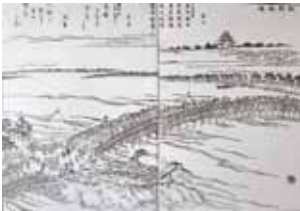
昔の枇杷島橋の風景