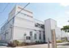
適応指導教室のある新川ふれあい防災センター