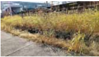
枇杷島駅周辺の草の繁茂

幹線市道及びその他市道の維持管理については、路面性状基礎調査、いわゆる道路ストック点検を実施して、点検結果を基に舗装個別施設計画書を策定して舗装修繕工事を行っています。