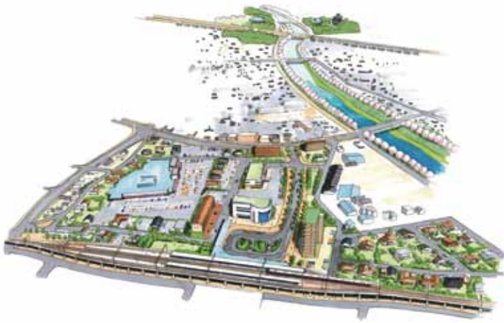
新清洲駅北土地区画整理事業(イメージ)

答 令和4年度から10年間の公園施設の修繕計画です。児童遊園等は策定していません。