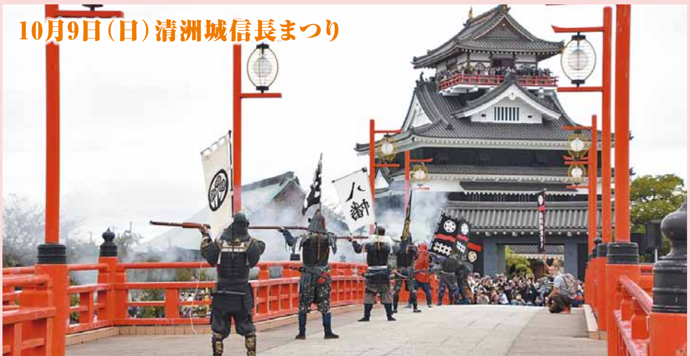
10月9日(日)清洲城信長まつり