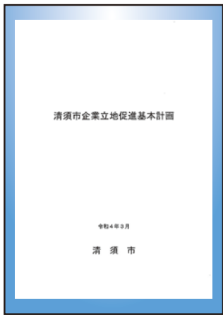
企業立地促進基本計画

問 企業立地促進基本計画策定費について、企業立地に関する支援策の実施にあたりコストがかかることが考えられるが、収支として市にプラスになるのか。 答 マイナスにならない支援策を検討していきます。