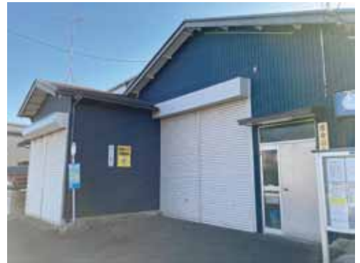
地区集会所整備費補助金を活用した集会所

答 前年度10月1日時点の人口割りで按分されています。本市の令和3年度按分率は、40.47%です。