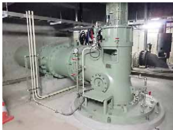
下水道事業 ポンプ場の更新

問 燃料等の高騰に伴う電気料金等の増額との説明があったが、予算科目によっては国庫支出金を充当する内容もあるが、その理由は。 答 事業者支援のため、指定管理者制度を導入している施設について、臨時交付金を充当したものです。