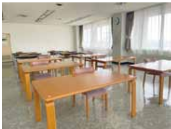
清洲市民センター 自習室