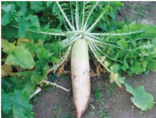
あいちの伝統野菜 宮重大根

答 地元独自の生産物が少ない中、特に「食」というコンテンツにおいて宮重大根は、あいちの伝統野菜に選ばれており、土田かぼちゃも来年度には認定される見込みです。こうした伝統野菜を後世に伝承する取り組みも食育を推進する上で大切なことだと考えています。