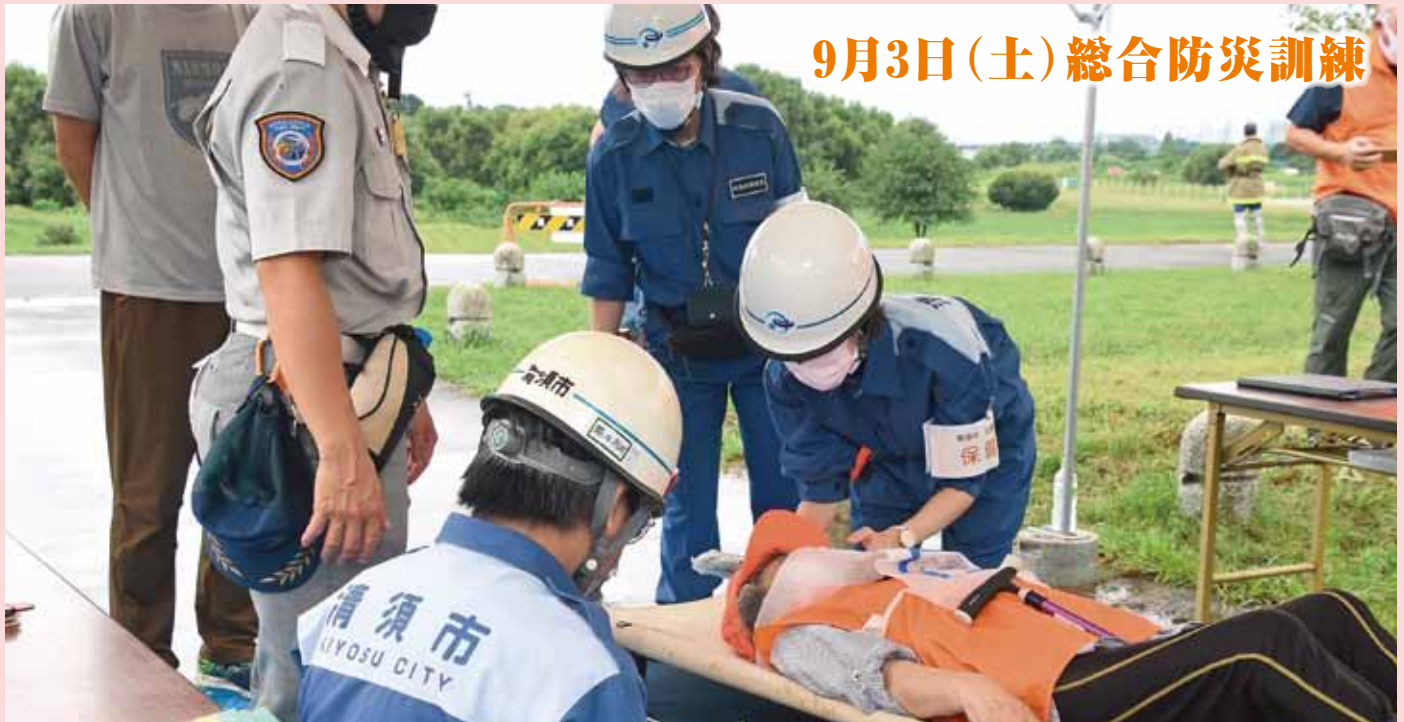
9月3日(土)総合防災訓練