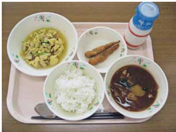
学 校 給 食

問 現在、物価高騰が続いている中で、学校給食における食材料費支出については、どのような状況か。