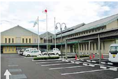
清洲総合福祉センター

答 エコステーションは24時間利用でき利便性が良いことから、ある程度の影響はあると思われれます。