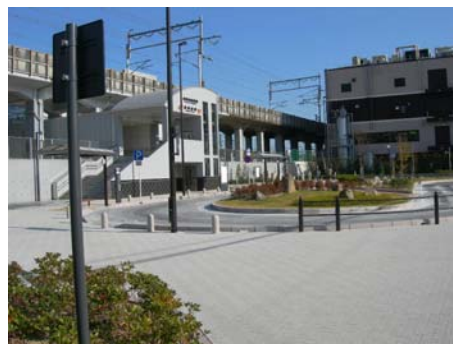
【駅前広場を有する駅】

鉄道駅及び駅周辺の緑地の維持管理では、市の顔として適正な維持管理に努める必要があります。日頃より良好な状態に保つことが必要なため、こまめな維持管理が求められることから、駅周辺の市民などの協力のもと、市民と協働して維持管理をする仕組みづくりを検討し、緑化を推進して市の顔にふさわしい景観形成に努めます。