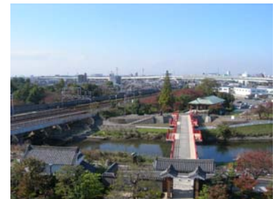
【清洲城からの風景】

清洲城・貝殻山貝塚周辺は市内の貴重な歴史遺産であり、緑を感じる場となっていますが、更にこれらの歴史遺産を活用しながら、緑化を推進し、楽しむ緑としての整備を目指します。