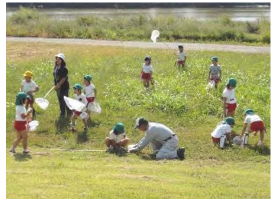
【緑の環境学習活動】

次代を担う子どもたちのために、生物の生息環境に配慮した緑の創出を積極的に行います。そのため、学校内に多様な生物の生息場所となるビオトープの整備の検討、水生生物などを観察するための水槽の設置など、生物を観察するための環境整備に取り組めます。また、ビオトープ、河川敷、農地などを活用して、子どもたちが水と緑にふれあう学習機会や学校等への出前講座などを実施して、子どもたちへの緑の環境学習活動を充実します。