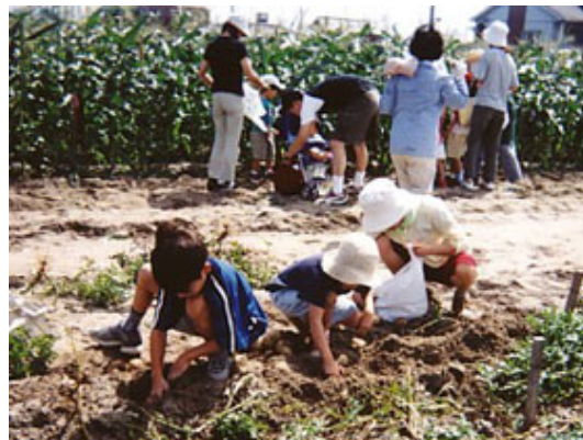
【農業体験イメージ】

遊休農地は、これまで十分な実態把握が出来ていないので、市民協力のもと実態調査を進め、活用できる遊休農地を把握します。その上で地域の実情を考慮し、市民農園などとして活用できる遊休農地は、市が借用するなどして、農業体験できる施設として開放すると共に、農業体験教室など農業に対する知識向上、農業を通じた地域づくりを図る機会を充実します。