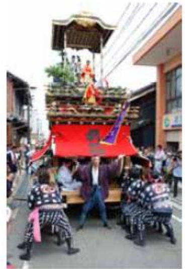
【尾張西枇杷島まつり】

美濃街道沿道の施設整備では、問屋記念館などの公共施設及び社寺仏閣など歴史的・文化的に価値の高い施設に対する誘導・案内看板の設置に努めます。また、沿道の施設や空町家などの利活用の検討やガイドボランティアによる歴史遺産などを紹介する人材育成を進め、活気と交流ある美濃街道沿道のまちづくりを進めます。