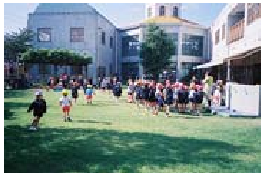
【園庭芝生化イメージ】