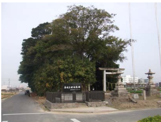
【社寺林：稲荷神社(春日三番割)】

市民が樹木・樹林地に関心を持ち、親しむきっかけづくりを進めるため、樹木・樹林地をテーマにした環境学習活動などに取組みます。