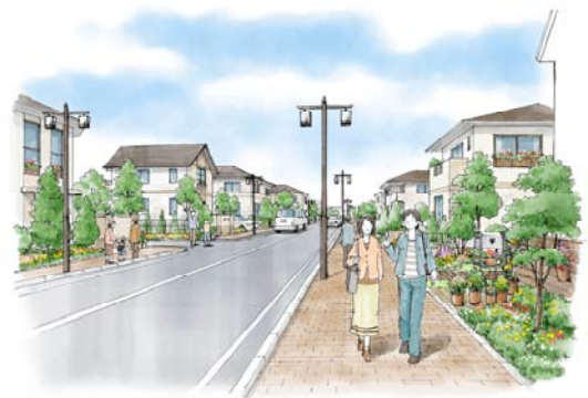
【道路沿道緑化イメージ】

住宅地では歩行者が安全・安心に利用できる道路として、コミュニティ道路の整備を進めます。コミュニティ道路では、道路の一角を活用し、地域のランドマークとして目に映える緑となる花壇や地域特性に合わせたシンボル樹木の植栽、ポケットパークの整備など、潤いある歩行者空間の創出に努めます。また、車両のスピード抑制施設の設置、道路に接する住宅の塀を倒壊しにくい生垣にするなどの工夫をして、交通災害の防止、自然災害時の避難路の確保に努めます。