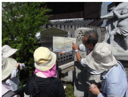
【ガイドボランティア】