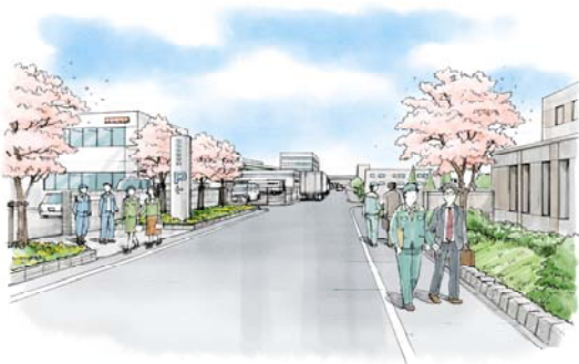
【公共施設緑化イメージ】

学校の校庭・保育園の園庭は広いスペースを有していて、まだ緑化する余地がありますが、単に緑の量を増やすだけの緑化ではなく、教育に緑を役立てる視点での緑化を進めることが必要です。具体的には、校舎周辺のスペースを活用した花壇を設置し、四季折々の花を育てることで花への愛着を高め、また、ピオトープを設置して自然観察の場をつくることで生物多様性の機運を高めていきます。更に、子どもたちの遊び場である公園や園庭などを芝生化して、裸足で遊べる環境づくりなどに取組みます。