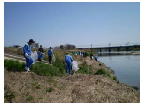
【河川敷での清掃活動】

計画の実現に向けては、庄内川河川敷の利活用を考える「清須かわまちづくり協議会」の仕組みを新川、五条川にも取入れ、市や河川管理者、市民、事業者が一体となって進めていくよう努めます。