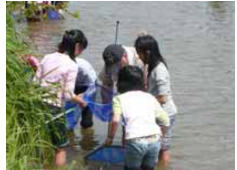
【水辺の環境学習活動】

河川敷に残された樹林地・草地を含む河川空間は、鳥や昆虫など生物の生息地として貴重な自然環境を有しているため、河川敷内の自然環境の保全が必要です。河川敷との移動回廊として、市内に点在する「緑」との連続性を考慮しながら河川敷の保全整備を進めます。都市計画決定している未供用の緑地については、緑と水にふれあう場を基本とした整備を進めます。このような施策により河川全体が本市にとって緑と水の回廊の骨格となり、多様な生物が共存できる環境を目指します。