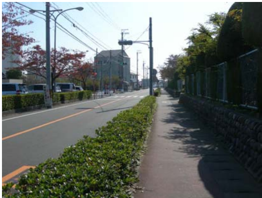
【幹線道路の街路樹】

広葉樹や落葉樹を植栽する場所に応じて選択し、季節感を演出するなど質の確保や延焼を抑制する効果が高い樹種の選定など、景観や防災などの視点から将来を見据えた、計画的な街路樹の更新を図ります。