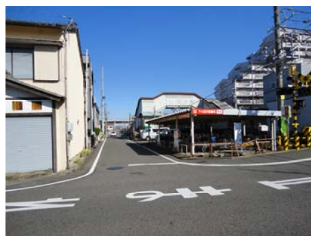
【駅前広場を持たない駅】