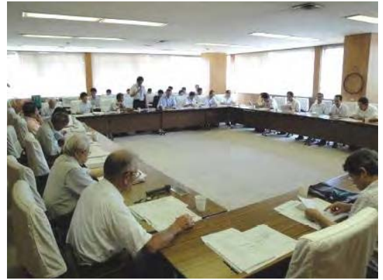
【緑に関する人材育成活動】

このため、公園緑地の維持管理や緑の知識習得に関する講座など、市民ニーズにあった多様な講座を開催して、緑に関する人材を育成します。更に、講座などを通じて知識を習得した市民が講師を務め、市民に知識を伝えるなどして、緑に関する人材育成の輪を広げます。