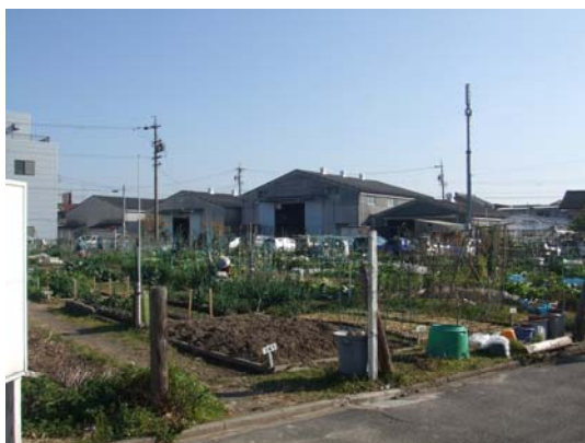
【市民農園イメージ】

遊休農地は適切な管理をすることにより、良好な景観を創出することが期待されます。市民農園などとしての活用が困難な遊休農地については、市民と行政が協働して花畑をつくるなど、良好な景観が形成できるよう工夫します。