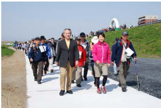
【ウォーキング大会風景】

散策路での清掃や緑化を推進するため、ボランティアによる活動を支援すると共に、活動の輪を広げます。また、散策路の利用を促進するため、散策路を活用したウォーキング大会などイベントの開催や環境学習活動にも積極的に取組みます。更に、清洲城の周辺施設やみずとぴあ庄内と市内主要駅を発着点としたレンタサイクルを検討するなど、散策路をより利用しやすくするための環境を整えます。