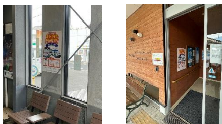
▲(左)ポスター・チラシ表, (右)チラシ裏 ▼ポスター掲載写真(鉄道駅・医療機関)