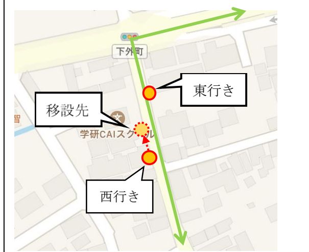
(1) バス停付近拡大図