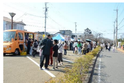
【令和4年度 記録写真】