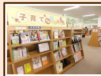
写真：清須市立図書館内

詳細な情報や最新の情報が知りたいときも、市のホームページなどにリンクができるため安心です。キーワードで検索することもできます。