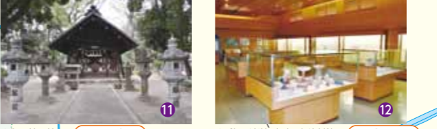
●御園神明社 ●●● 一場 戦国時代には、この門前で御園市 (三八市) が開かれていました。