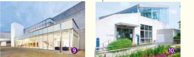
●清須市立図書館 ●●● 夢広場はるひ 美術館や公園を一体とした清須市の文化ゾーンとして広く利用されています。