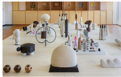
▲《encounter 45 with barrack》2022年 ミクストメディア(「瀬戸現代美術展2022」での展示風景/菱野団地、2022年)