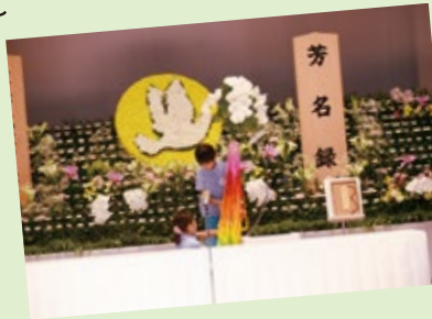
【保育園児による千羽鶴の献上・平和宣言】