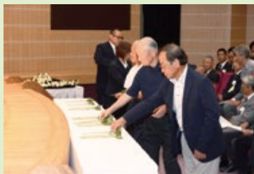
【式典参加者の献花】