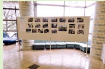
【派遣研修の記録展示】