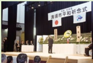
【平和祈念のこぼし】