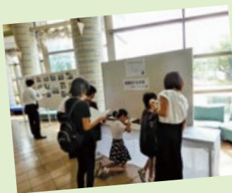
【式典会場の記帳所・平和へのメッセージ】