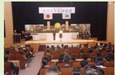
【平和推進派遣研修代表児童】