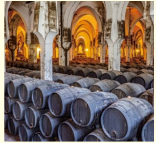
高い壁などの工夫で湿度を保つことができる「bodega」(=酒蔵)

そのため、19世紀から、ヘレス市の街並みはbodegaの建築の影響を受けています。ヘレス市のbodegaは、形は四角形に切妻屋根で、海風を受けるように海の近く又は高い土地に建てられています。地上にあるため、さまざまな保湿対策がなされています。まず、アンダルシアの強い日照を避け、北西・南東向きに建てられています。厚さ60センチ、高さ14メートルぐらいの高い壁の真上に、横長な窓があります。その窓は海風が通るようにガラスの代わりに木材の「ceñosia」(=格子)が使われています。bodegaは土床になっていて、必要な時に水まきをすることによって、夏にでも湿度と室温を保つことができとても便利です。