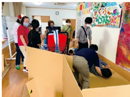
ダンボールベッドを体験する参加者

6月半ばに、清須市阿原にある福祉発信基地友の家「ほしのみや」へ、ボランティア団体「防災カフェ」はるあき」の皆さんと伺いました。この日、ほしのみやでは、避難所訓練を実施するというところで、職員の皆さんとダンボールベッドを作成し、利用者の方にベッドで寝てもらったり、ダンボールで作成したトイレに座ったりと、いろいろな体験をしました。