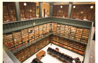
ヘレス市立図書館兼資料館