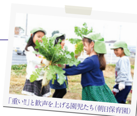
「重い!!」と歓声を上げる園児たち(朝日保育園)

子どもたちは、大きく育った宮重大根を引き抜こうと、力いっぱい大根を引っ張り上げていました。