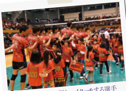
キッズエスコート隊とハイタッチする選手

この日は、清須市ホームタウンデーということもあり、多くの清須市民が応援に駆けつけ、会場は熱気に包まれました。