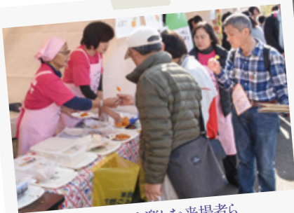
各ブースを楽しむ来場者ら

食育トークや地元特産品である宮重大根入り豚汁の無料配布などが行われ、多くの人でにぎわいました。