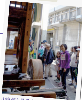
山車蔵を見学するウオーク参加者たち

山車を見学するコースでは、日頃は見られない山車蔵の中も見学でき、約650名の参加者が清須のまちめぐりを楽しみました。