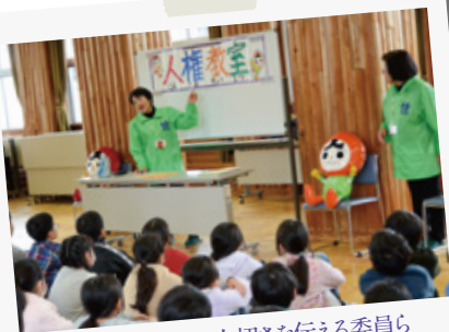
相手を思いやる大切さを伝える委員ら

「第70回人権週間」に合わせて、市人権擁護委員の方々が市内の小中学校で人権啓発活動を行い、みんなで一緒に人権について考えてもらいました。