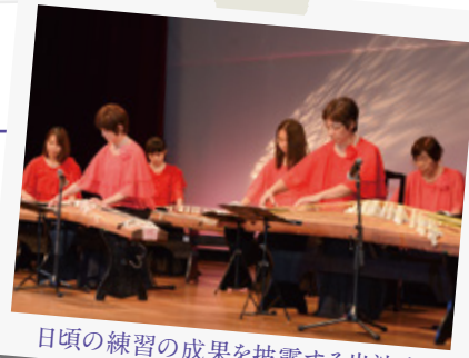
日頃の練習の成果を披露する出演者