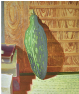
田中秀介 《いりいるうり》2017年