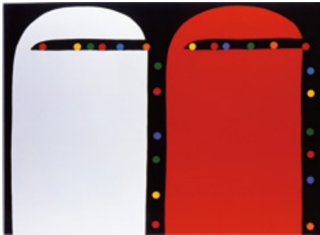
《いろいろなあか》2001年、アクリル・カンヴァス、宝塚市