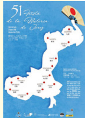
「ヘレス コン ハボン」のポスター

皆さんは、フラメンコショーを観たことがありますか。もし、8月にヘレス市に行くことがあれば、Fiesta de la Buleriaに参加するといいですね。