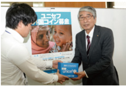
募金箱を受け取る河合国際交流協会会長

多くの外国コイン募金にご協力ありがとうございました。引き続き、外国コインを集める募金箱を生涯学習課(南館1階)の窓口を設置しておりますので、ぜひ募金にご協力をお願いいたします。