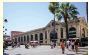
メルカド セントラル デ アバストス

清須市では毎月第一日曜日に朝市が開催されますが、スペインの各町には毎日営業する市場があるので、習慣が結構違っておもしろいですね。