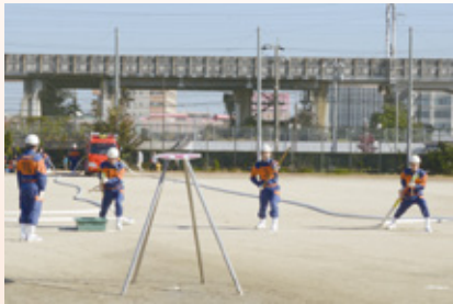
■問合せ 防災行政課(北館3階)

とき 11月12日(日) 午前9時30分から ところ 西枇杷島中学校グラウンド ※雨天時は、同校体育館で行います。