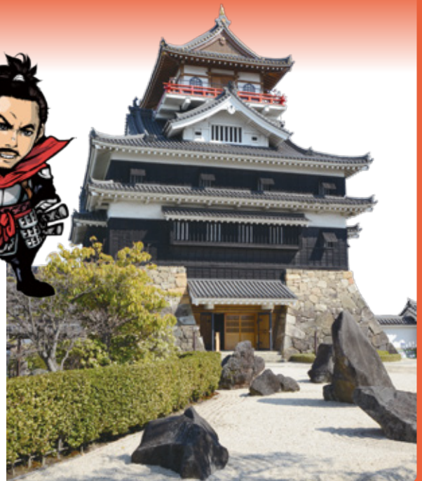
■問合せ 産業課(南館3階)