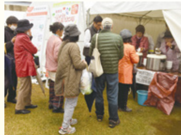
■問合せ 産業課(南館3階)