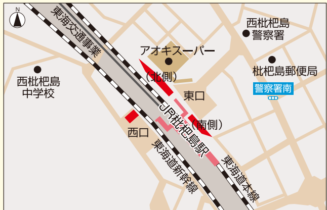
<枇杷島駅自転車等駐車場位置図>

また、管理人が東口南側の管理室に駐在し、各駐車場の巡回管理、場内の駐車自転車等の整理整頓及び場内清掃の実施、防犯対策として防犯カメラ、防犯ベルを設置するなど、利用者の方が快適に利用できるように努めます。