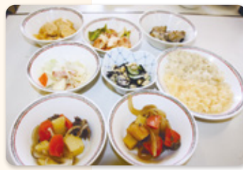
料理教室で作られた料理

ら出る水分のみで調理をしたりします。例えば、茶飯やオレンジジュースご飯、肉じゃが、パイナップルパンケーキなどがあり、これらは、熱に強いビニール袋に材料すべてを入れ、味を調え、中の空気を抜きつつ袋を縛り、熱湯の鍋に入れ、加熱し調理します。