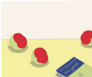
《スモモ》シルクスクリーン、1991年

安西水丸は、1970年代より小説、漫画、絵本、エッセイや広告など多方面で活躍したイラストレーターです。明快な色合い、モチーフの大胆な配置、最小限の要素で構成された画面からは、温かな静けさが漂います。本展では、「小さい頃よりずっと絵を描くことが好きだった」と語る安西の幼少期から晩年に至るまでの足跡を、イラストレーションの作品を軸に辿ります。