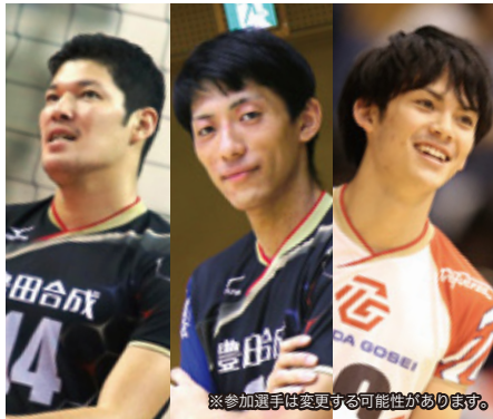
※参加選手は変更する可能性があります。

所在地：〒452-0961 清須市春日夢の森1番地 電話：052-400-1044 開館時間：午前10時～午後7時 休館日：5/1(月)・8(月)・15(月)・22(月)・29(月)・31(水)