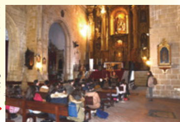
サン・マテオ教会を見学するヘレス市の生徒たち