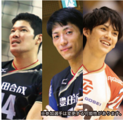
※参加選手は変更する可能性があります。

TOYODA GOSEI 2015/16 V・プレミアリーグ男子優勝 豊田合成トレフェルサ