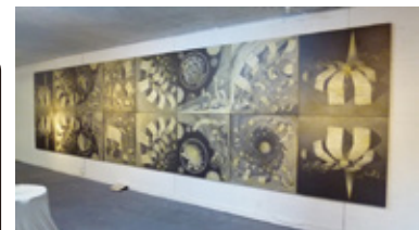
《のしてんてん「浄土」》2014年

画材はシャープペンシル。 緻密な描写に驚かされます！ いくつかの作品を組み合わせたり、空間全体を構成したりとスケール感の大きな展示です。