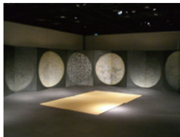
《のしてんてん「歲月」》2009年