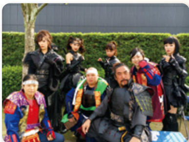
清洲城ボランティア武将と清洲城武将隊焔組キラメキダッシュ

嬉しい気持ちと3度目の参加という事もあり、緊張することも少なく、心にも余裕ができたのか、自然に笑顔で手を振りながら、来場