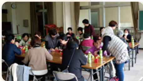
阿原女性の会 活動風景

会は、こうした活動を通じて、会員同士が街のどこで会っても気軽にあいさつができるようになった事が、誇りだそうです。また、会員一人ひとりが、「楽しくやろう」という思いで、会を盛り上げていくそう、それが長く続く秘訣なのかもしれません。