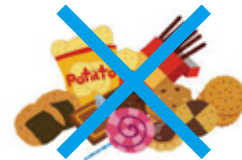
食べ過ぎや間食を控える