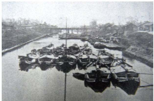
昭和11年 新川荷揚場

■問合せ 生涯学習課(清洲市民センター)☎052-409-6471【月曜日休み】