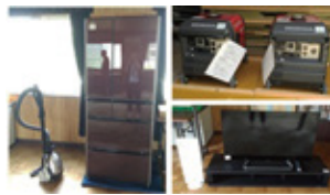
清洲第7ブロックが整備したコミュニティ備品

清洲第7ブロックが一般財団法人自治総合センターの宝くじの普及広報事業により、コミュニティ備品の整備を行いました。今後、地域のコミュニティ活動の推進に活用されます。