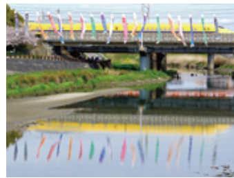
コインボりに囲まれたドクターイエロー