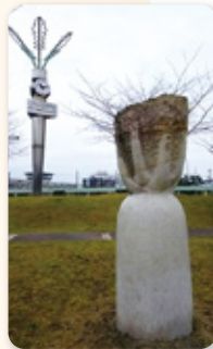
宮重大根の オブジェ

心をほっこりさせたい時、私は 「あしがるバス」に乗り、「夢広場は るひ」へ出かけます。「夢広場は るひ」には、「市立図書館」、「はるひ美 術館」、「はるひ夢の森公園」の3つ の施設があり、市民の憩いの場と なっています。五条川沿いの道か ら入って行くと、春日の名産「宮 重大根」の大きなオブジェがお出 迎えをしてくれます。