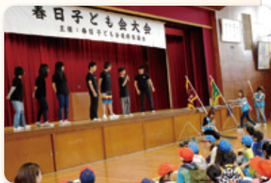
春日子ども会大会で小学生たちにゲームを教えるジュニアリーダー

清須市子ども会連絡協議会では、子ども会活動に欠くことのできない「ジュニアリーダー」の育成と資質の向上を目指すため、他のリーダーと交流することで、「規律」・「協力」・「親睦」を学ぶ体験ができ、ジュニアリーダーとしてのスキルアップにつながるかと考え、毎年、東尾張地区リーダー研修会や春日井市ジュニアリーダー養成講習会に積極的に参加してきました。