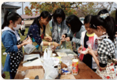
ハイゼックスを使って防災食作りをするジュニアリーダー(写真中央)

役となります。東海豪雨から15年目を迎える節目の年となるので、「防災」をテーマにしたキャンプを企画しています。ハイゼックスを使って防災食を作ったり、新聞紙で作った紙コップ・スリッパを使用するなど、体験活動を積極的に取り入れていく予定です。