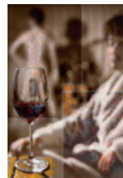
1 山崎直秀《DRAWING-PHOTOGRAPHY 1407》