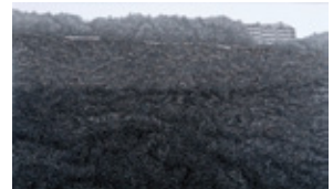
野中洋一《海辺の療養所》