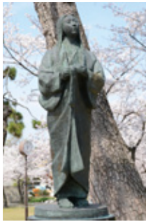
清洲公園の濃姫像