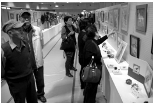
作品を鑑賞する来場者