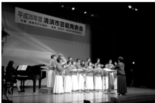
「女声合唱こすもす」による合唱