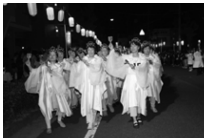
タイトル「総おどり」