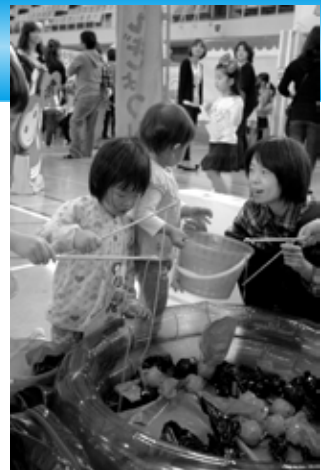
「昨年の児童館まつりの様子」