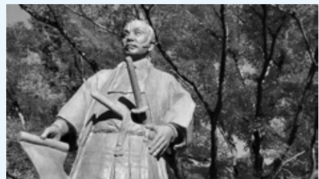
「コリア・デル・リオ市にある 支倉大使の銅像」