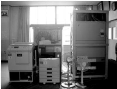
鍋片コミュニティの備品