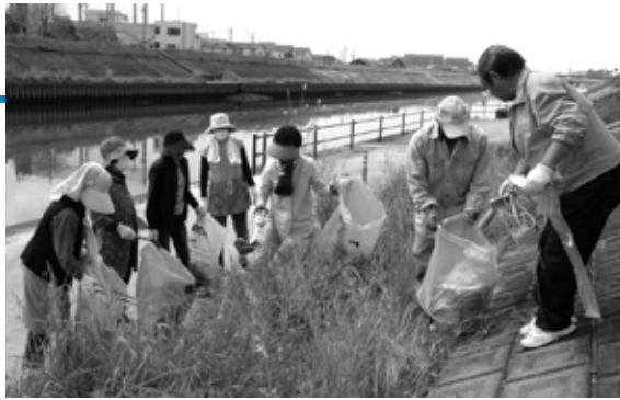
清掃を行う市民の皆さん

新川中学校の生徒や、市民・地元企業の方々など約300名が参加し、「新川・五条川クリーン大作戦」が行われました。参加者は複数のグループに分かれ、新川と五条川の川沿い約15キロメートルにわたり、清掃活動に取り組みました。