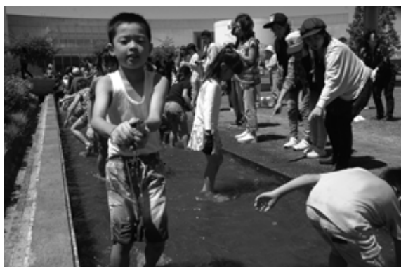
マスのつかみ取りをする児童たち