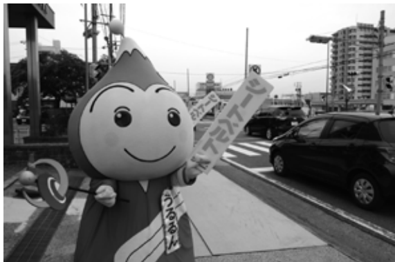
西枇杷島警察署前でシートベルト着用の啓発活動を行う「うるるん」