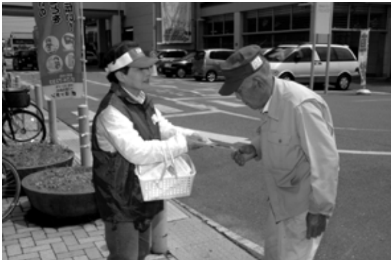
PR活動をする赤十字奉仕団員