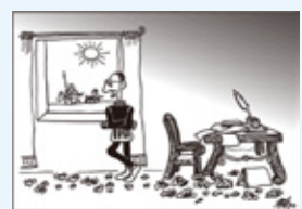
「ドン・キホーテ」を想像しているセルバンテス