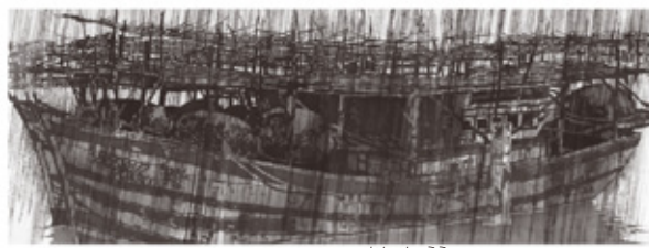
かん しゅう 雨 《還一驟雨》2001年 六曲屏風

昨年12月、ベトナムで日越外交関係40周年を記念して開かれた個展で発表された《辿りついた場所》三部作が、日本初公開されるのも本展の見どころ。実際に使用した型紙もあわせて展示します。お見逃しなく！