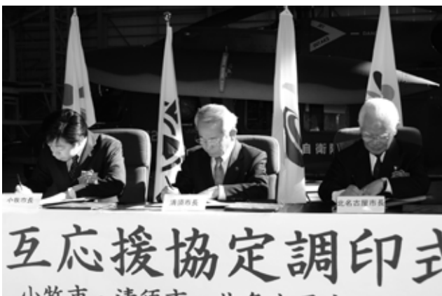
協定書に署名する(写真左から)山下小牧市長、加藤清須市長、長瀬北名古屋市長

協定は、どちらかが被災した際には支援物資を提供し、職員を派遣する内容となっており、本市を始め3市1町は東松島市との協力関係を強くし、東松島市が行う復興への取り組みを学んでいきます。