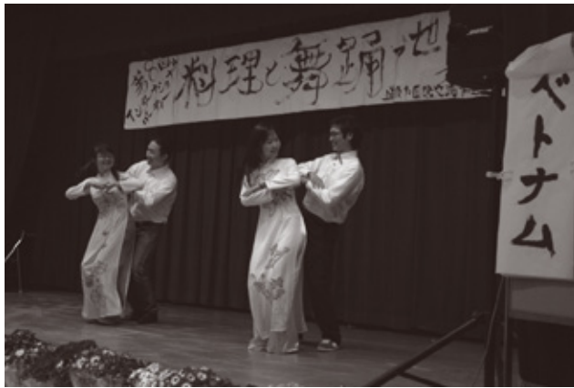
アオザイをまとったベトナム人による舞踊

会場にはアフガニスタンやフランスなど全部で8か国の伝統料理を楽しめるブースが並び、ステージでは各国の歌や踊りなどが披露され、参加者たちは交流を楽しみました。