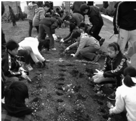
◀ビオトープ整備の一環として行われた花植えの様子

この活動は、「あいち森と緑づくり事業」の一環として行われたもので、学校では今後整備したビオトープを活用し、蝶などの昆虫観察に役立てていきます。