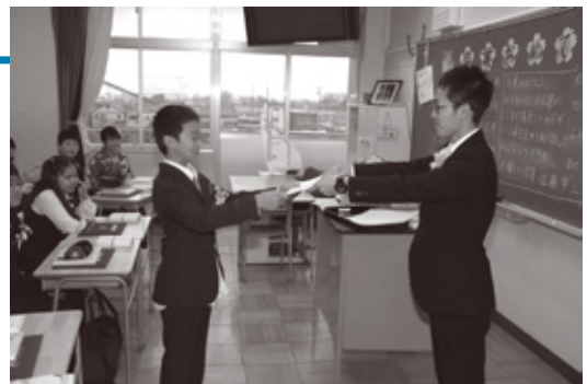
卒業式後の教室での様子(桃栄小学校)