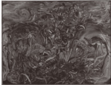
《もう一つの神話》2010年