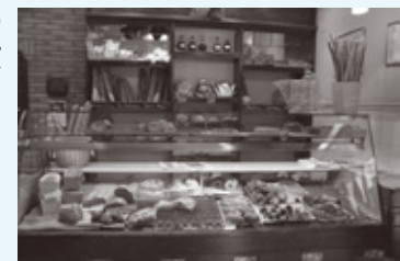
エリさんの家のあるパン屋さん