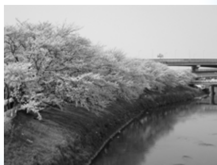
五条川沿いの桜並木

清洲城及び清洲ふるさとのやかたは、3月24日(月)・31日(月)、4月7日(月)・28日(月)も休まず開館します。