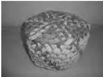
牛乳パック正座椅子