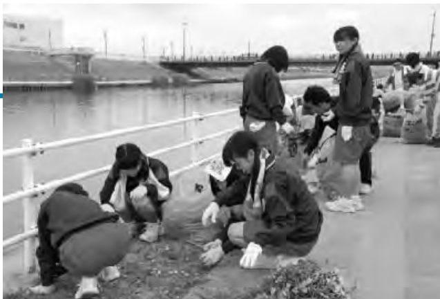
清掃を行う新川中学校の生徒の皆さん

新川、五条川、庄内川堤防を中心に、市民約3,000人による清掃活動が行われました。この活動には、新川中学校の生徒や、市内から五条高校に通う生徒らも参加し、草取りやごみ拾いを一生懸命行いました。