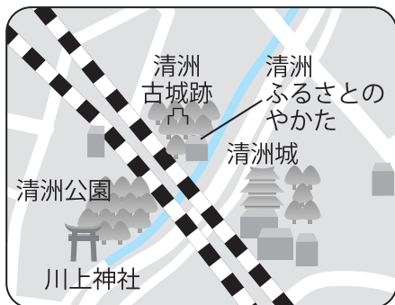
自転車歩行者専用道路区間

左図の箇所が、8月1日から終 日自転車及び歩行者のみ通行が可 能な「自転車歩行者専用道路」と なりますのでお知らせいたします。