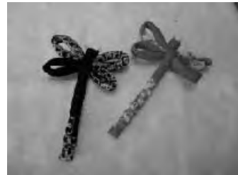
トンボのブローチ