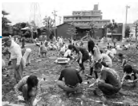
芝生を植える市民の皆さん

公園の芝生化に取り組むため、約150名の市民の皆さんが西須ヶ口公園に芝生を植えました。この活動は、「あいち森と緑づくり事業」の一環として行われ、今後、芝生の管理は公園がある外町の自治会をお願いします。